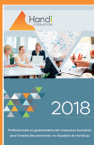
Le catalogue Handi-formation