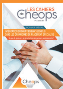
Les cahiers de Cheops