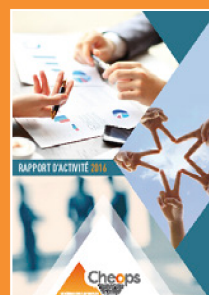
Le rapport d'activité